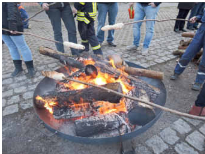
Die neue Feuerschüssel im Einsatz unter dem Knüppelkuchen

Wie gestalten wir dieses Jahr das Osterfeuer? Das war die große Frage in Bresegard bei Picher. Denn es stand fest, dass der bisher genutzte Platz am Feuerwehrhaus wegen der dort verursachten Baumschäden nicht mehr in Frage kam, und der neue Feuerplatz auf dem im Bau befindlichen Generationenplatz noch nicht existierte. Feuerwehr, Dorfclub und Gemeinde fanden schnell eine sehr schöne Lösung. So fand das Osterfeuer dieses Jahr am Gemeindehaus statt, mit Fackeln, zwei Feuerschüsseln und einem Feuerkorb.