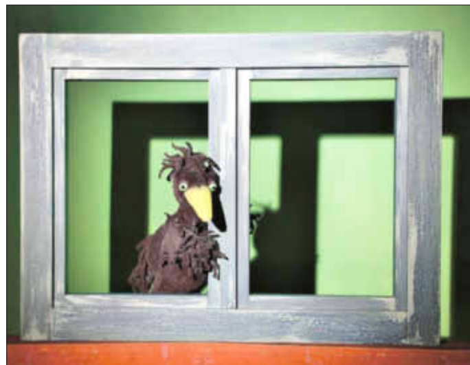
Szenen aus dem Puppenspiel „Richard, der stärkste Rabe der Welt“

Bilderautor: Das Tandra Theater aus Testorf