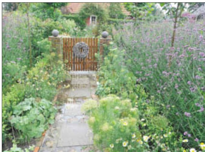
Die Gartenpforten werden am 10. und 11. Juni 2017 in 137 Gärten für Besucher geöffnet.

Termin: 10./11. Juni 2017, Offene Gärten in MV