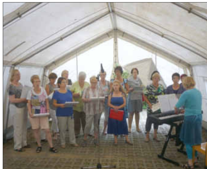
Auftritt des Chores zum 20jährigen Bestehen des Gemeindehauses in Bandenitz/Radelübbe