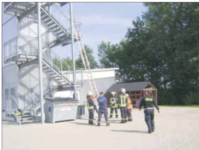
Eindrücke von der Prüfungsvorbereitung 23.08.2012

Wir danken allen Kameraden für die Bereitschaft sich in ihrer Freizeit aus- und weiterzubilden. Ein weiterer Dank gilt allen Familienangehörigen, die den Kameraden den „Rücken freigehalten“ haben und somit auch einen großen Teil für die erfolgreiche Ausbildung leisteten.